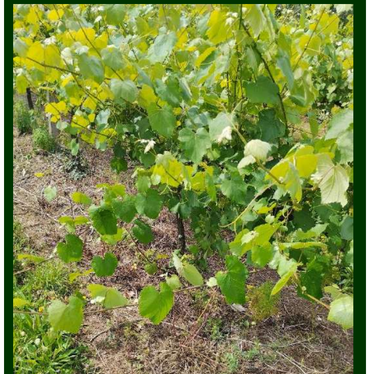
Fig. 57 Lançamentos prostrados junto ao solo, que funcionam como elevadores do mídio, pois vão ser as primeiras folhas a serem contaminadas. Situação que também deve ser evitada.