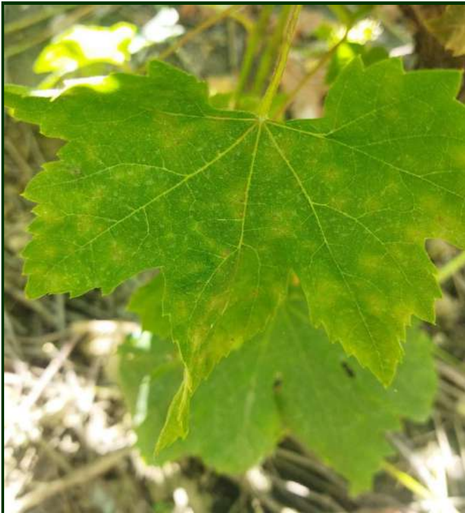
Fig. 5 e 6 - Sintomatologia do oídio na folha