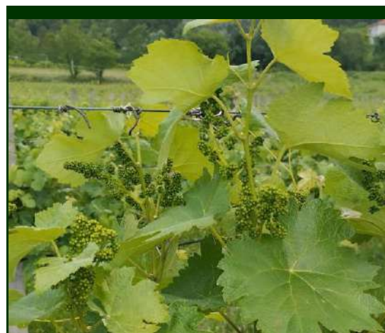
Fig. 1. Estado fenológico H (57) - botões florais separados

No combate ao míldio em vinhas no Modo de Produção Biológico e Convencional, estão autorizados os produtos indicados nos Quadros 1 a 1.7 (anexo).