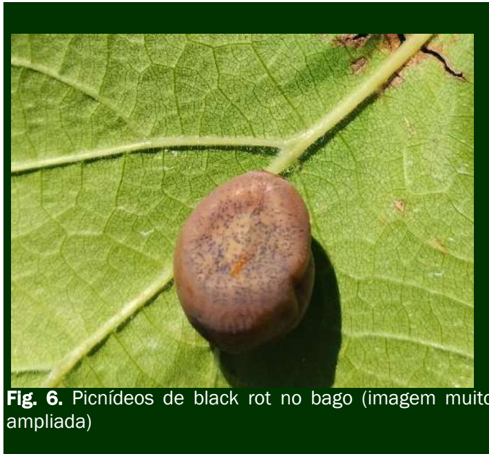
Fig. 6. Picnídeos de black rot no bago (imagem muito ampliada)

No combate ao black rot em vinhas no Modo de Produção Biológico e Convencional, estão autorizados os produtos indicados nos Quadros 2 a 2.1 (anexo).