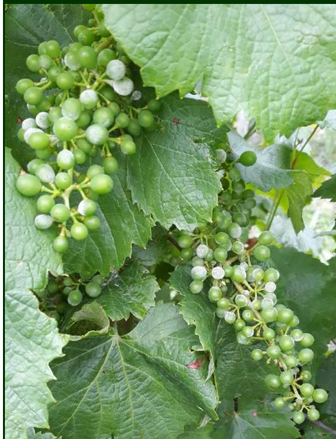
Fig. 4 Oídio no bago, logo após o “grão de chumbo” (Não confundir com esporulações do míldio)