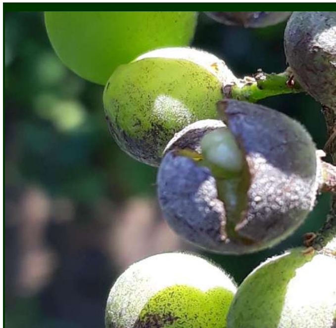
Fig. 3. Bago rachado provocado por ataque Oídio

recomendado pois melhora o vingamento pelo estímulo da fotossíntese.