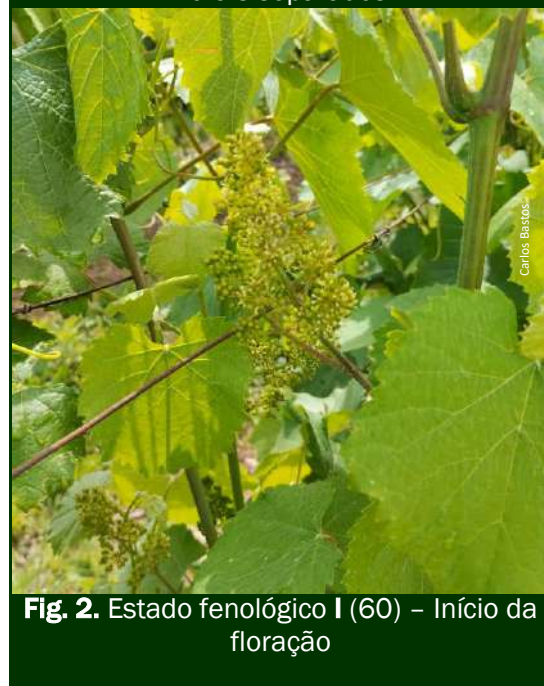
Fig. 2. Estado fenológico I (60) - Início da floração