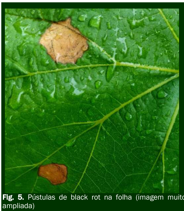
Fig. 5. Pústulas de black rot na folha (imagem muito ampliada)